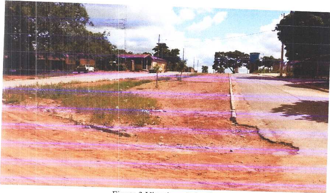
Figura 3 Vista isométrica 1.