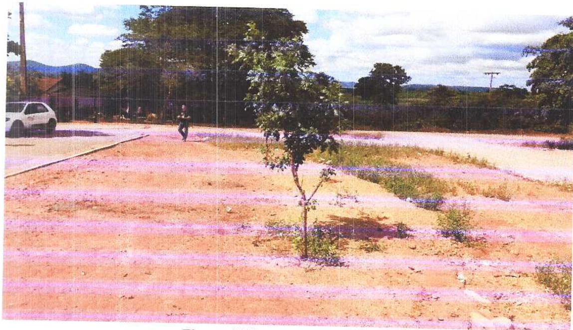
Figura 4 Vista do meio da praça. Fonte: Acervo pessoal Acesso em: 24/03/2020.