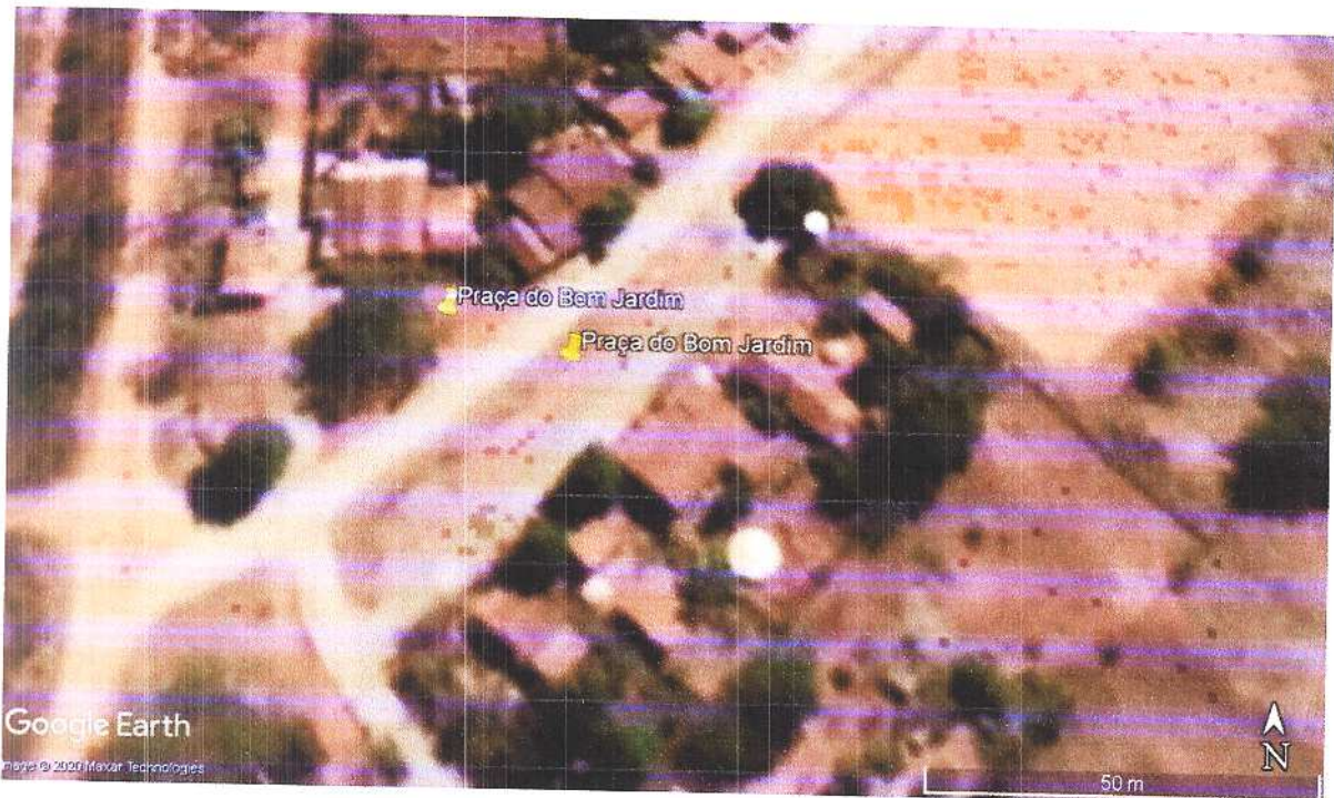
Figura 8 Vista aérea da Praça

Fonte: Acervo pessoal Acesso em: 24/03/2020.