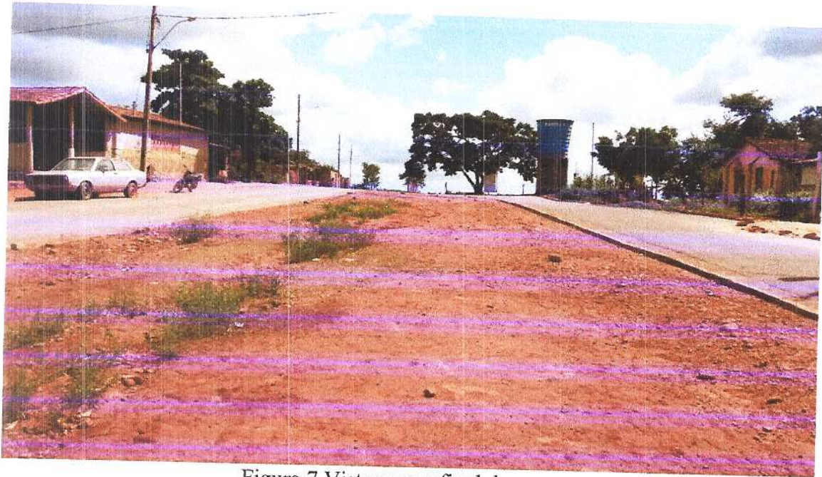
Figura 7 Vista para o final da praça.

Fonte: Acervo pessoal Acesso em: 24/03/2020.