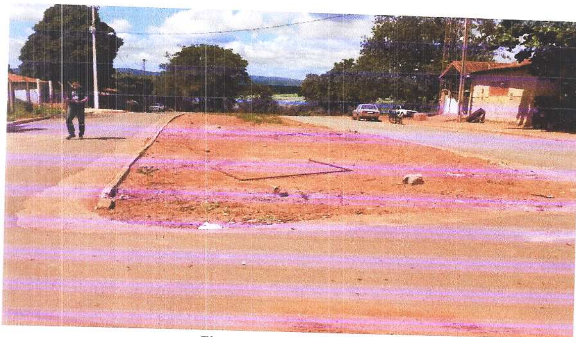
Figura 5 Vista isométrica2. Fonte: Acervo pessoal Acesso em: 24/03/2020.