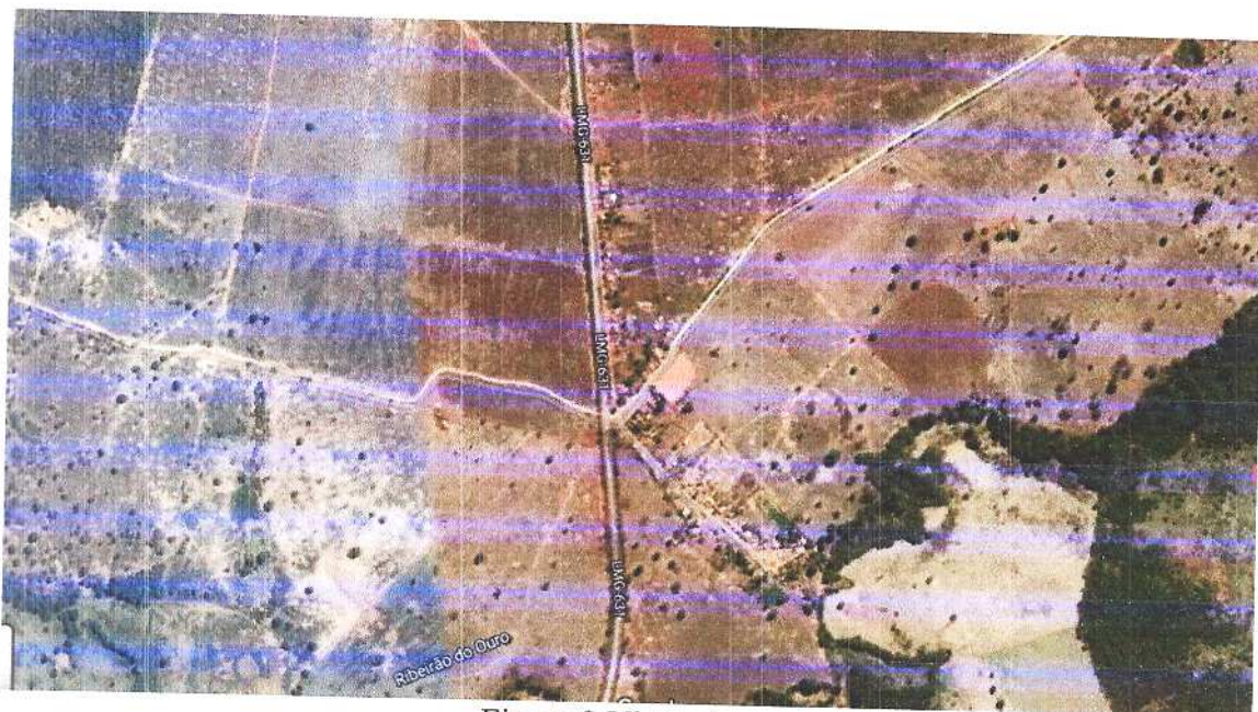
Figura 2 Vista aérea