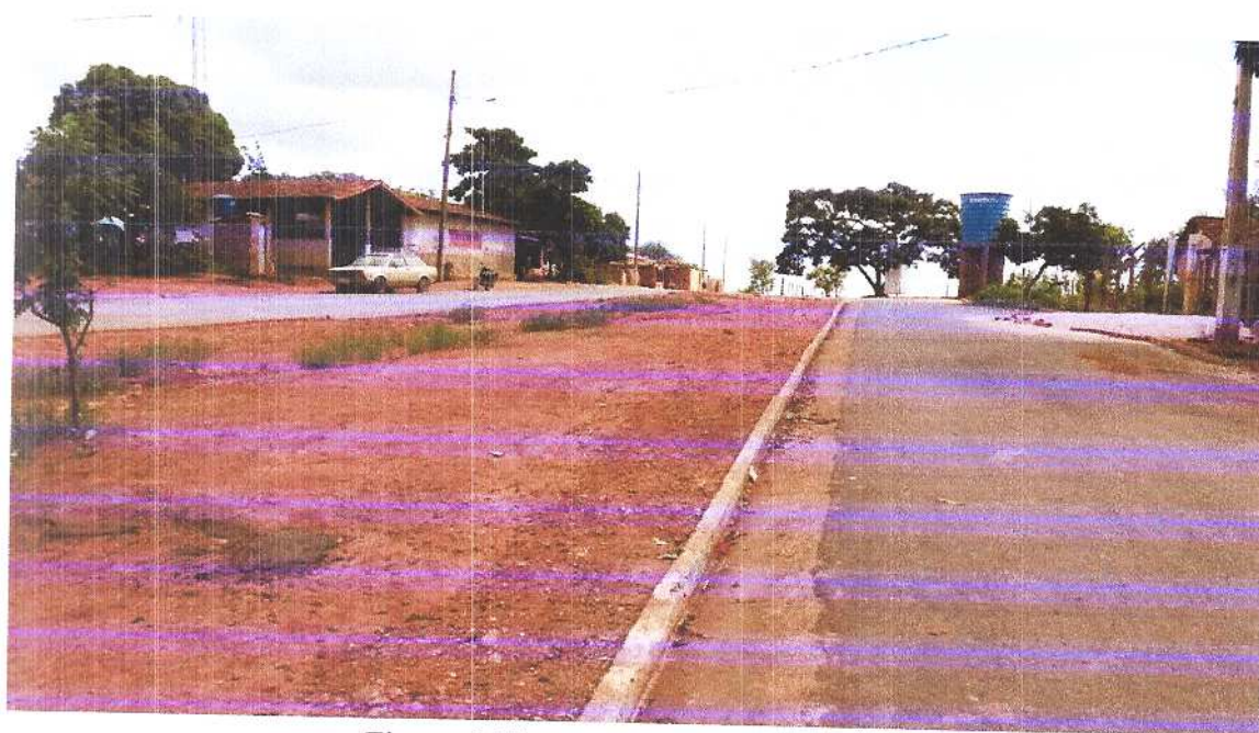
Figura 6 Vista a partir da rua paralela. Fonte: Acervo pessoal Acesso em: 24/03/2020.